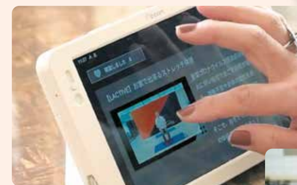
簡単なボタン操作で使える