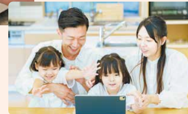
遠く離れた家族とビデオ通話